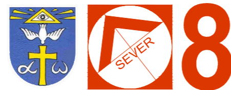
SCHÉMA ZÁVÄZNÝCH ČASŤÍ A VEREJNOPROSPEŠNÝCH STAVIEB V ZASTAVANOM ÚZEMÍ - PO ZMENE